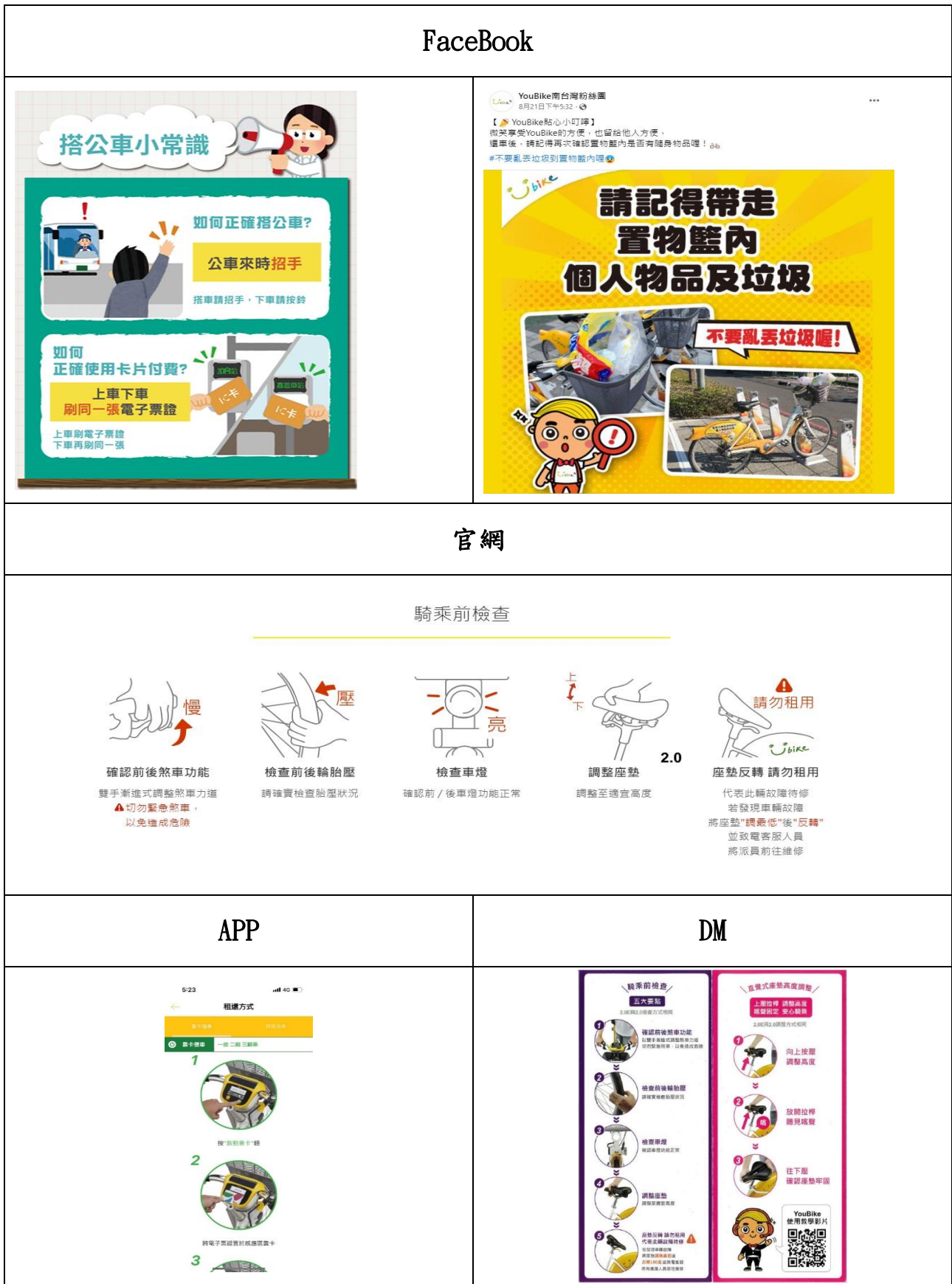
附表5：交通局宣導內容