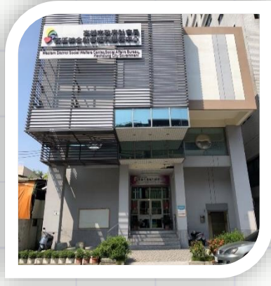
左營社福中心 左營區實踐路4號