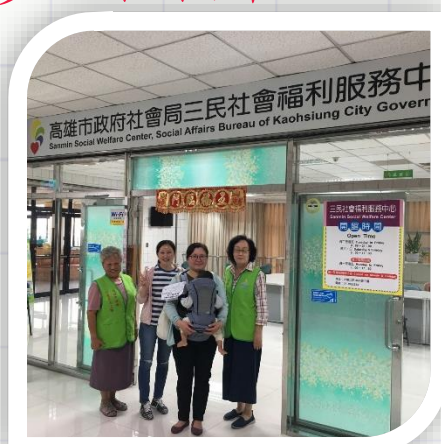
三民社福中心 三民區大順二路468號7樓