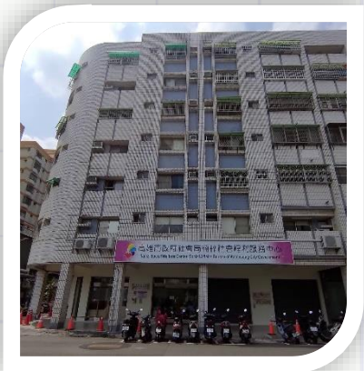
楠梓社福中心 楠梓區德賢路139、141號