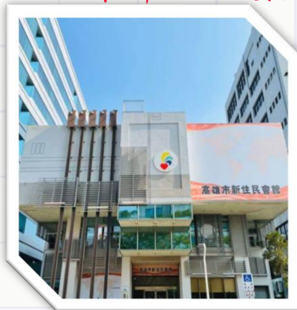
新興社福中心 新興區中正三路36號