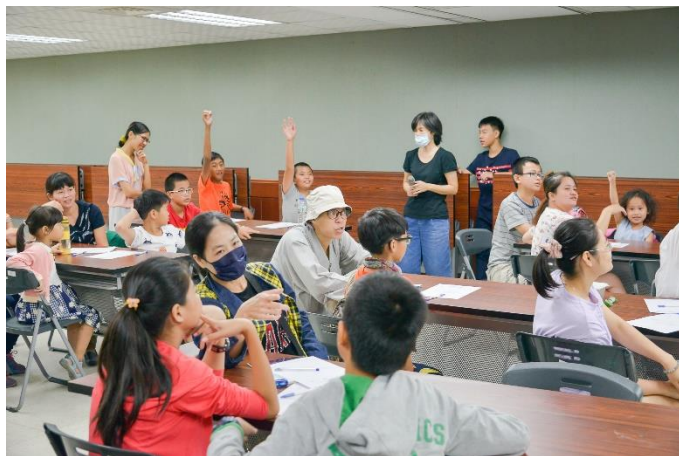
理財規劃你的深口袋（鹽埕中心）