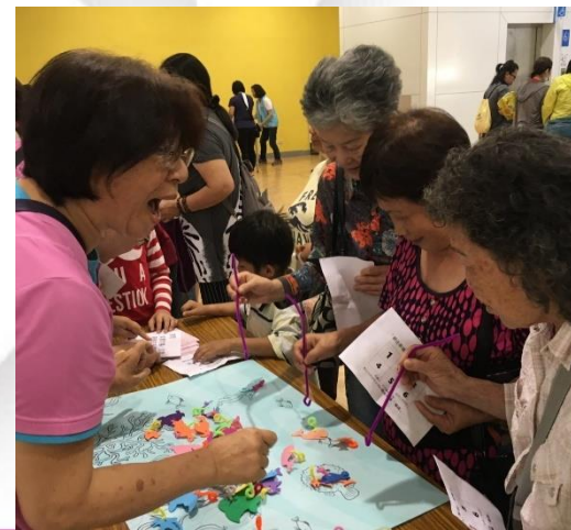
網住幸福（苓雅中心）