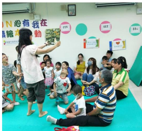
心有我在-繪本故事課程 （小港中心）