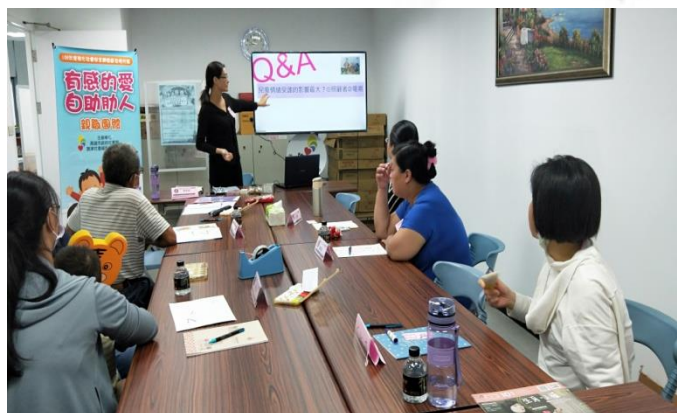
有感的愛-自助助人親職團體 （旗津中心）