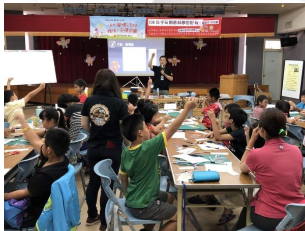
手玩創意科學好玩（前鎮中心）