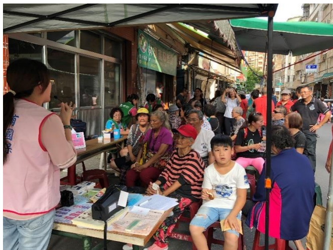
↑ 社區好康報報-與府北里辦公室、阮綜合醫院走入社區，辦理骨質疏鬆檢測及社福資訊宣導（鹽埕中心）