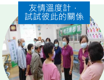
女性增能專題 成就一手拿鍋鏟 一手拿麥克風