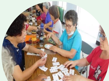
性別議題專題 逗陣來做家內事 - 談家務分工