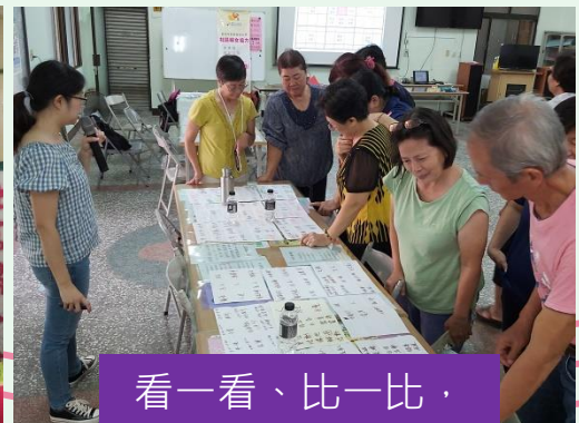
看一看、比一比， 我們有甚麼不同