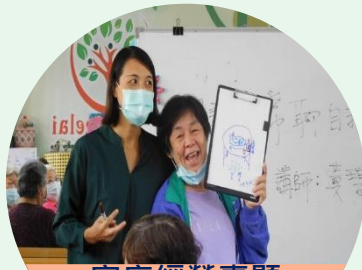
家庭經營專題 閒話家常 聊自我照顧