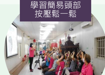
身心保健專題 【健康呷百二】 從鬆筋談自我照顧