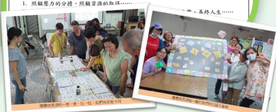
團體成長課程—看一看，比一比，我們有甚麼不同