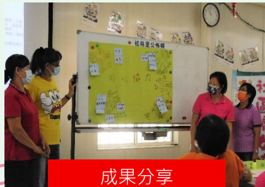
成果分享 綻放你的美！