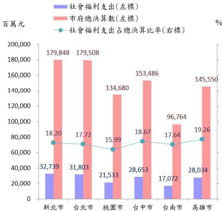
表 1 111 年六都社會福利支出占該市府總決算情形表