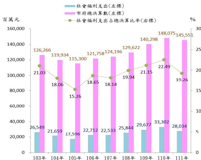
圖2 103~111年高雄市社會福利支出占地方總決算情形

111年本市總歲出決算1,455億5,070萬元，教育科學文化支出546億971萬7千元占比37.52%最多，社會福利支出280億3,443萬8千元占比19.26%次之，一般政務支出245億2,683萬5千元占比16.85%再次之。社會福利支出中以福利服務支出占比最多，醫療保健支出次之，社會保險支出再次之。111年社會福利支出占市府總決算19.26%較110年22.49%減少(-3.23%)，較109年21.15%減少(-1.89%)，主要係109年因增加編列長照十年計畫2.0相關補助及六大生活津貼補助等、110年增加編列勞健保積欠還款等，故占比成長。111年因勞健保積欠還款已於110年度還畢，故占比降至19.26%。(詳圖1、圖2)