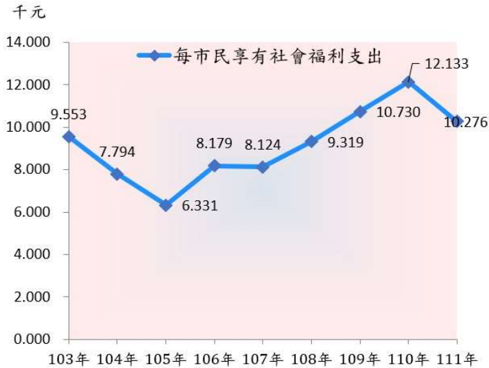
圖 4 103~111年高雄市每市民享有社會福利支出情形