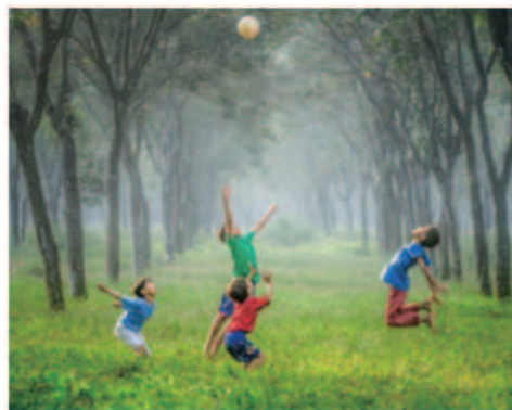
教育休閒文化活動