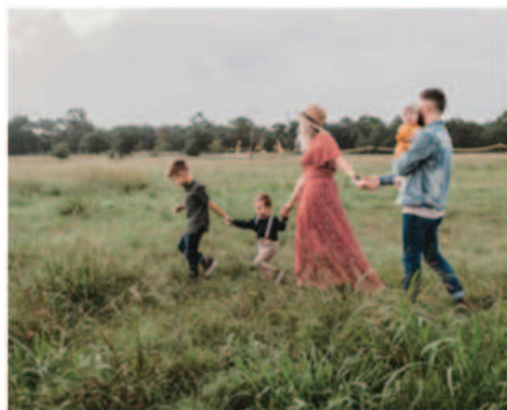
家庭環境與替代性照顧